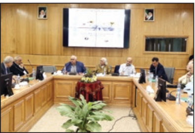
در همایش «ایران در پیچ‌وخم توسعه» مطرح شد